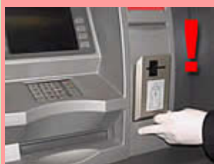
Okienko wrzutowe z założonym dodatkowym czytnikiem kart

Jeśli zauważysz przedstawione przeróbki (pokazane na czerwonym tle) to nie korzystaj z bankomatu, a o swoich spostrzeżeniach powiadom Policję!