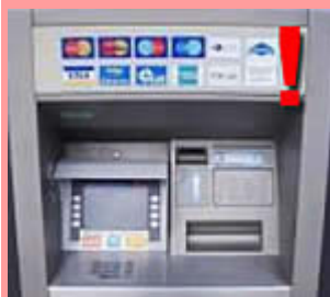
Bankomat z założonym nad wyświetlaczem "daszkiem", pod którym ukryta jest kamera skierowana na klawiaturę

Jeśli zauważysz przedstawione przeróbki (pokazane na czerwonym tle) to nie korzystaj z bankomatu, a o swoich spostrzeżeniach powiadom Policję!