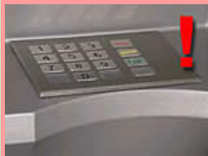
Klawiatura z założoną nakładką