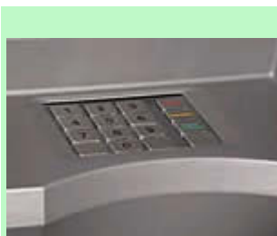
"Zwykła" klawiatura bankomatu

1. Wykorzystanie czytnika kart magnetycznych i nakładki na klawiaturę lub kamery zainstalowanych na bankomacie. Umożliwia to poznanie przez sprawców kodu PIN i skopiowanie karty magnetycznej. Przy pomocy "sklonowanej" w ten sposób karty, i znając numer PIN, sprawcy wypłacają w bankomacie pieniądze z konta.