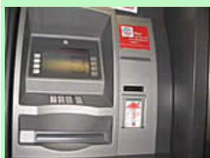
"Zwykłe" okienko wrzutowe czytnika kart w bankomacie