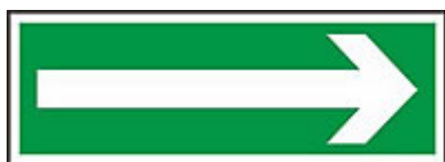
Kierunek drogi ewakuacyjnej

Poniżej przedstawiono podstawowe symbole ewakuacyjne: