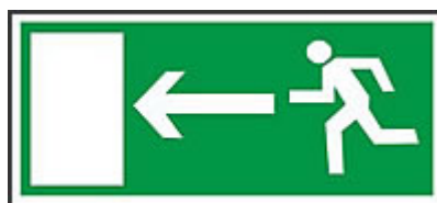
Kierunek do wyjścia drogi ewakuacyjnej